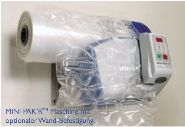
MINI PAK'R™ Maschine mit optionaler Wand-Befestigung.