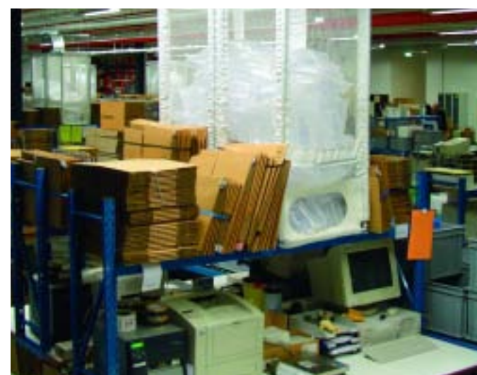
Behälter mit Eingriff

Ein Automatic Delivery System (ADS) transportiert Luftkissen von der Maschine direkt zum Packplatz. Die MarkII Luftkissenmaschine kann versehen werden mit einem Schneidemechanismus, womit Stranglängen von einer bestimmten Länge produziert werden. Die Stranglänge wird abgestimmt auf die Anzahl Luftkissen, die am meisten benützt wird pro Verpackung, und kann variieren von 3 bis 20 Luftkissen. Die Luftkissen werden dann mittels Gebläse durch einen Kanal zu einem Auffangbehälter, der über dem Packtisch hängt, transportiert. Der Packer braucht nur noch die Luftkissen aus den Eingriff an der Unterseite des Behälters zu nehmen, und kann die Kissen direkt verarbeiten. In den Auffangbehältern sorgt eine Lichtschranksteuerung dafür, dass die Maschine ein Signal bekommt wenn ein Behälter befüllt werden muss. Eine Maschine kann so mehrere Packplätze/Behälter mit Luftkissen versehen.