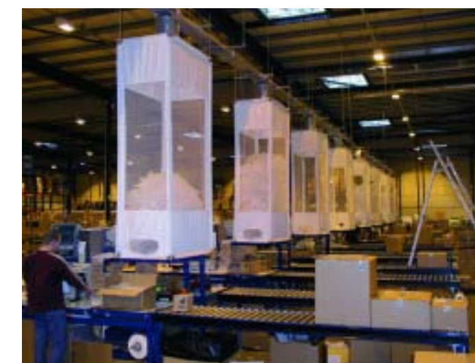
Automatic Delivery System

Ein ADS ist 100% maßgeschneidert, und ist somit integrierbar in fast jede bestehende logistische Situation. Das bedeutet dass ein einfaches System gebaut werden kann für 2 Packplätze, aber auch Systeme um 30 Packplätze mit Luftkissen zu bedienen. Wir erfassen Ihre logistische Situation und Ihre Wünsche, und beraten Sie dann über die beste Lösung.